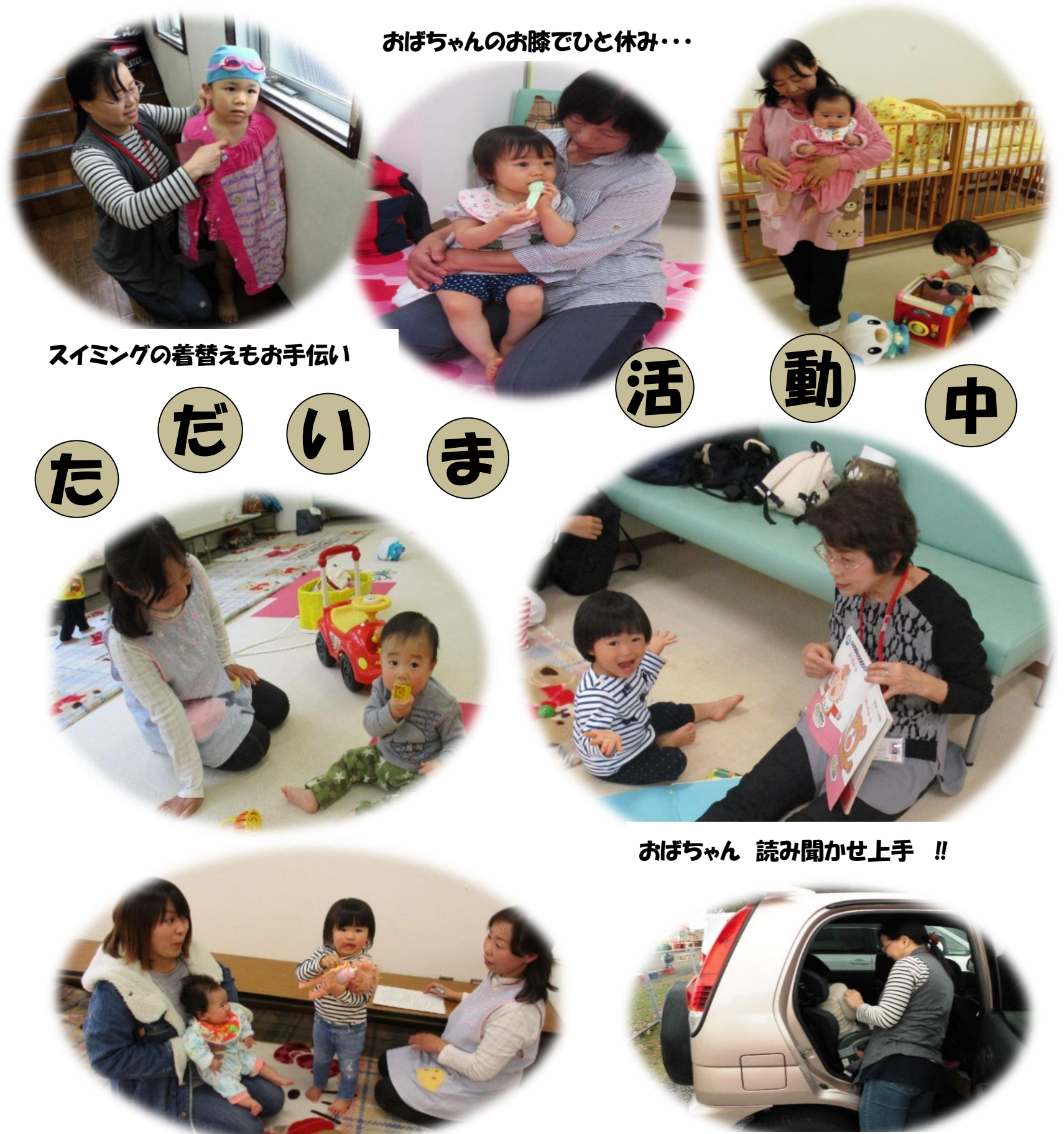
おばちゃんのお膝でひと休み・・・