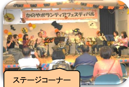
ステージコーナー