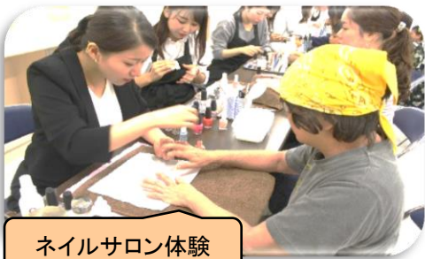
ネイルサロン体験