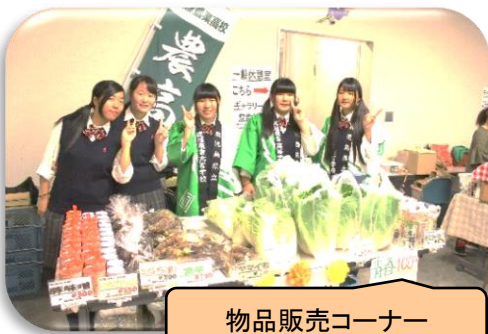
物品販売コーナー