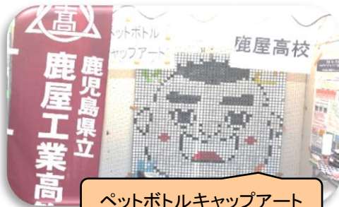
ペットボトルキャップアート