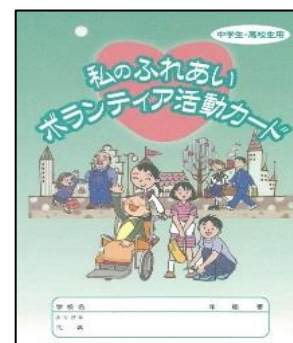
中学生・高校生用