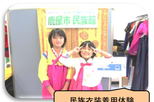
民族衣装着用体験