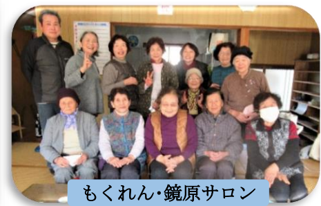
もくれん・鏡原サロン