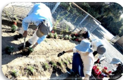
今年も花植えをしました。 [花壇はいつも花が咲いています。]