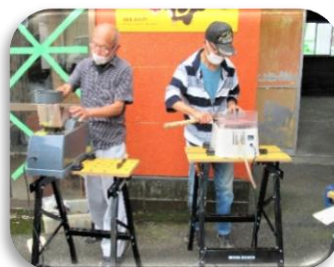
作業台で仕事が楽になりました。 [刃物とぎもはかどります]