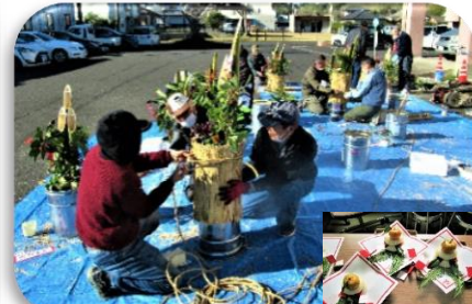
今年も皆で協力して作成 [鏡餅を添えて進呈しました。]