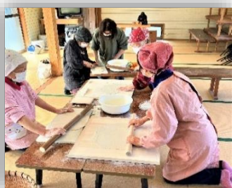
道具も揃い一緒にそば打ち [皆で美味しく頂きました]