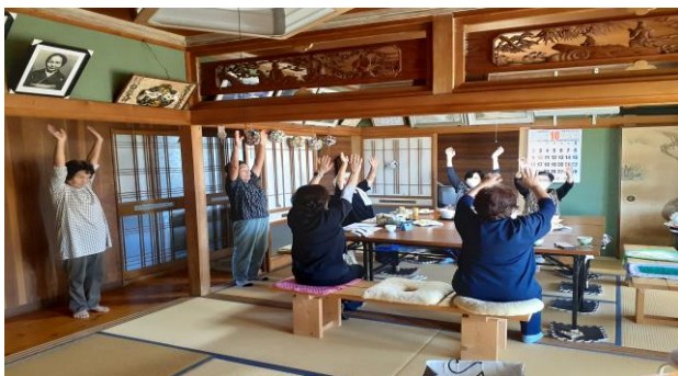
今年度から始まった堅田サロン

ふれあいサロンは地域の方々が気軽に集まってお茶を飲みながらおしゃべりをしたり、楽しくレクリエーションをしたり、健康づくりのための体操をしたりして、仲間と楽しい時間を過ごせる場所です。現在、串良地域でも様々なサロン活動が開催されています。興味のある方は是非参加してみませんか。