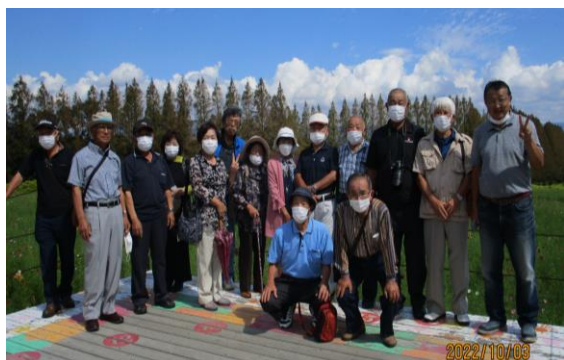
高齢者クラブ研修旅行

会員相互の親睦と積極的な社会参加を図ることを目的とし、グラウンドゴルフ大会や研修旅行、ボランティア活動等の活動を行っています。随時、会員を募集しています。多くの方の加入をお待ちしています。