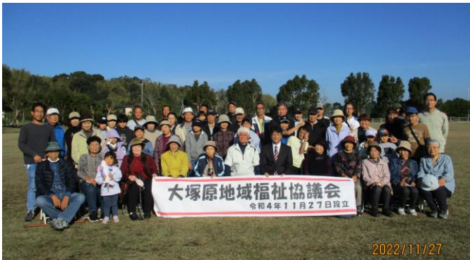
大塚原地域福祉協議会設立式

地域福祉協議会は、少子高齢化が進行するなか、地域の生活課題、福祉課題を地域住民自ら把握し解決に向けた住民主体の活動につなげるための「話し合いの場」として推進しています。今回、大塚原地域福祉協議会が設立され、いつでも安心して暮らせる住みよい地域づくりを目指した取り組みが期待されます。当日は、毎年恒例の3世代交流GG大会も開催され、楽しい地域の交流になっていました。鹿屋市では、これまで14カ所の地域福祉協議会が設置されています。