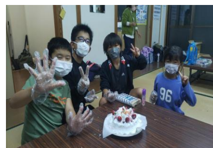
クリスマス交流会 (大塚原こども育成会)