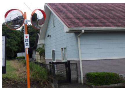
ロードミラー設置 (大迫町内会)