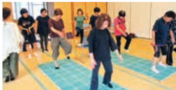
元気度アップ事業の実施