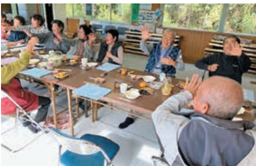
高齢者サロンの支援