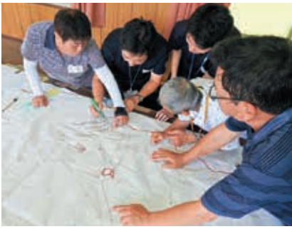
支え合いマップ作りの支援

② 地域共生社会の実現に向けた地域づくりを目指し、地域福祉や地域の活動をテーマに地域住民等を対象とした研修会や、こ