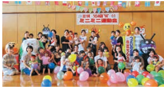
つどいの広場 “りな”