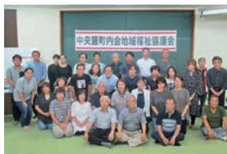
吾平中央麓町内会 (令和2年5月11日設立)

今年度新たに3つの町内会で、地域福祉協議会が設立されました。地域福祉協議会とは、身近な地域の日常生活上の困りごとなど、福祉に関する課題を地域住民や社協等の支援関係者で共有し、その課題の解決を目指して、定期的に話し合いを積み重ね、結果として住民主体の助け合い・支えあい活動を創造するものです。令和元年度は、7ヶ所の地域福祉協議会が発足しましたので、これで市内10ヶ所の設立となりました。住みなれた地域で安心して生活していくためには、その地域で生活される皆様“お一人おひとりのご理解とご協力”が必要です。社協では、今後も地域福祉協議会の設立を通して、より良い福祉コミュニティの構築に努めてまいります。