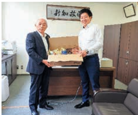
マルハン鹿屋店様