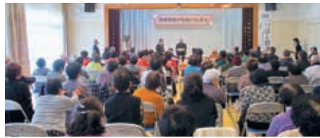
吾平ふれあいフェスタの実施