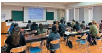
ボランティア養成講座の実施