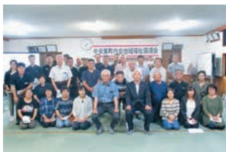
吾平中央東町内会 (令和2年4月16日設立)