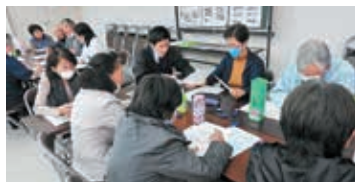
地域づくりセミナー