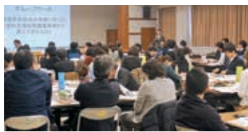
第4回九州ブロック研修会

③ 1つの機関では対応できない複合的な課題を持つ世帯に適切な支援機関（高齢・障害・児童等）をコーディネートし、分野横断的な支援を行いました。