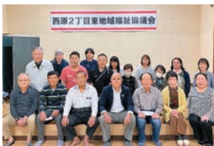
西原2丁目東町内会 (令和2年5月8日設立)