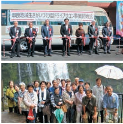
ドライブサロンの実施