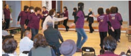
串良ふれあいフェスタの実施