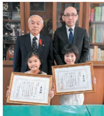
福祉作文コンクールの実施

③ 在宅や地域において、一時的に車イスを必要とする市民に対して無料で貸出しを行いました。また、教材として高齢者疑似体験セット等の貸出しを行いました。