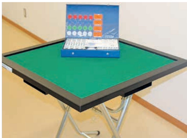
健康麻雀セット(足付台も含まます)

サロン活動や地域で活動している団体などの皆様に、レクリエーション用具の貸し出しを無料で行っています。今回新たに「健康麻雀セット」が加わりましたので紹介いたします。健康麻雀は指先を動かし、次の一手を考えるため、自然と脳を活性化させるので認知症予防につながります。特に、シニア層の間では、安心安全に交流しながら楽しめるゲームとして、全国的に健康麻雀を楽しむ人口が増えています。地域交流の用具としてぜひ、ご活用ください。