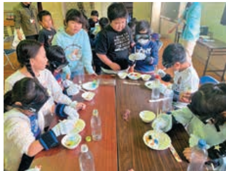
福祉体験出前講座の実施