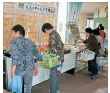
やすらぎ市場の実施