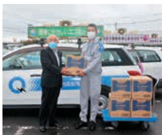
九州電力送配電(株)鹿屋配電事業所様