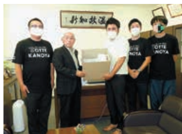
鹿屋商工会議所青年部様