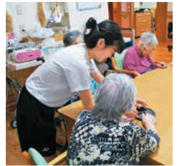
サマーボランティア 体験学習の実施

特別養護老人ホーム鹿屋長寿園 特別養護老人ホーム以和貴苑 特別養護老人ホーム悠々 特別養護老人ホーム朋愛園