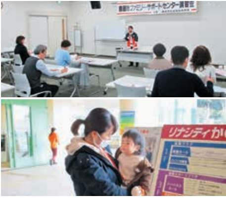
ファミリー・サポート・センター