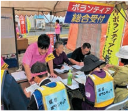
災害ボランティアセンター 設置訓練の実施