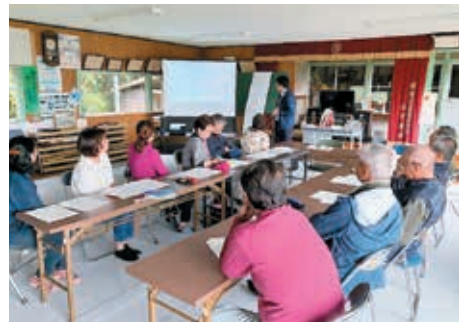
地域福祉協議会定例会の様子