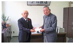
鹿屋市高齢者クラブ連合会