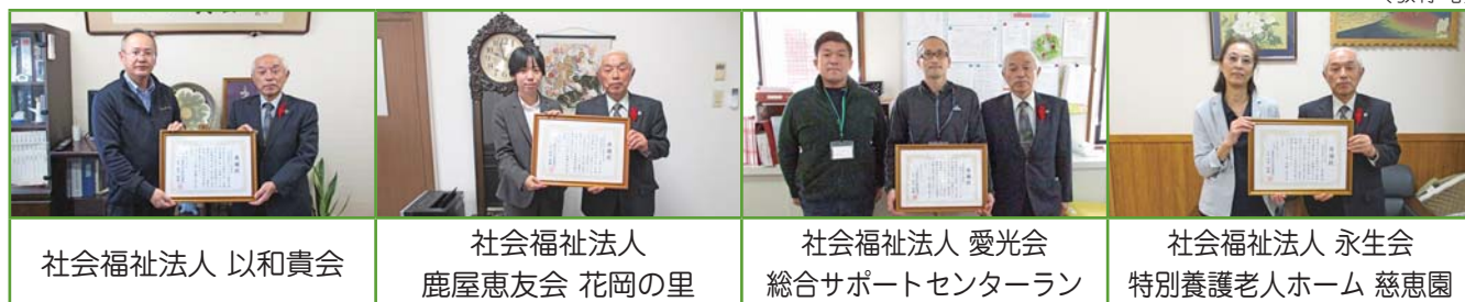
社会福祉法人 以和貴会