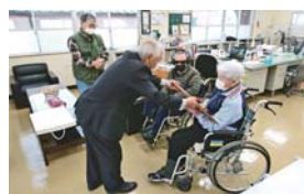
星塚敬愛園自治会