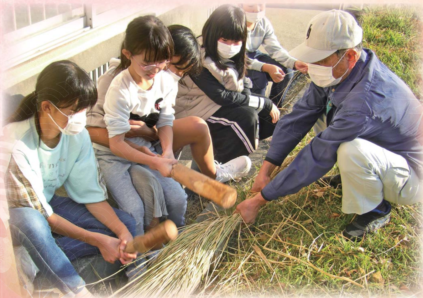
ユクサおおすみ海の学校（天神町内会）