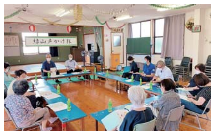
緑山声かけ隊 定例会に参加