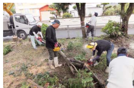
西俣盛り上げ隊社青年部にいま隊 (鹿屋) (西俣小学校環境整備)