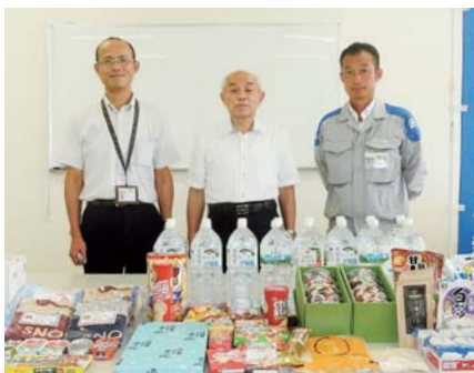
九州電力送配電(株) 鹿屋配電事業所