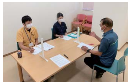
地区の民生委員さんに民生委員児童委員の活動についてお話を伺いました。