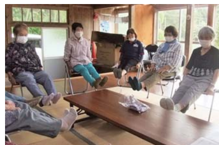
堂平ミニサロン (輝北) (運動サロン用パイプ椅子の配備)