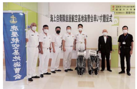
海上自衛隊鹿屋航空基地 海曹会