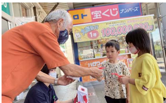
コープかごしま鹿屋店

10月1日（金）に赤い羽根共同募金の街頭募金運動を実施しました。昨年同様コロナの影響もあり、規模を縮小して、市内8店舗と71名のボランティアの皆様にご協力をいただき、76,257円の募金を頂きました。ご支援いただきました皆様に感謝申し上げます。