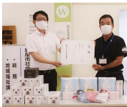
(株)ダイナム鹿児島鹿屋店