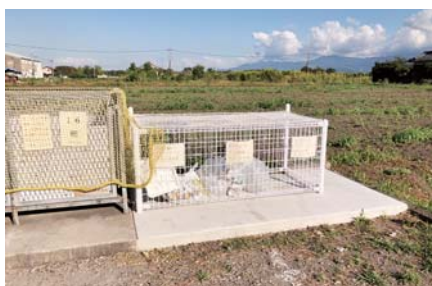
新川町内会 (鹿屋) (ゴミステーションの整備)