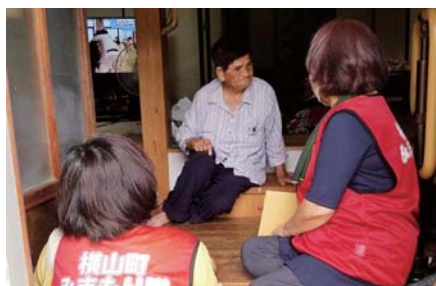
横山町女性見守り隊 (鹿屋) (見守り活動用ベストの配備)