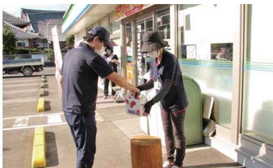
ファミリーマート輝北百引店