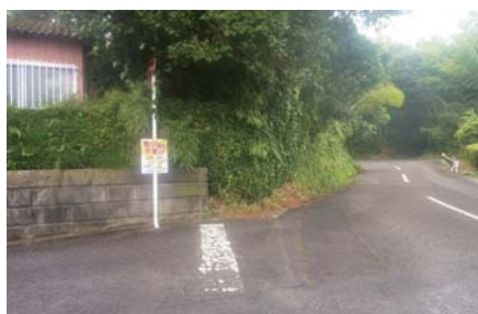
新大塚原町内会 (串良) (子供飛び出し注意看板設置)