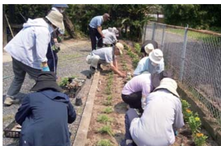
高齢者クラブ「八幡長寿会」(吾平) (鶴峰地区ふれあいセンター花壇の整備)