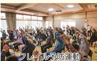
フレイル予防運動

11月7日(火)に、今年度から「輝北町合同福祉スポーツ大会」を「輝北町福祉交流レクリエーション」に名称変更して実施しました。