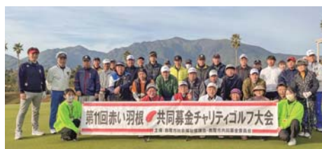
チャリティゴルフ大会 32組 119名参加 募金 104,337円

10月18日(水)に第15回赤い羽根共同募金チャリティグラウンドゴルフ大会、12月9日(土)に第11回赤い羽根共同募金チャリティゴルフ大会を開催しました。たくさんのご参加・ご協力ありがとうございました。