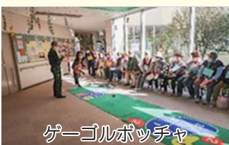
ゲーゴルポッチャ