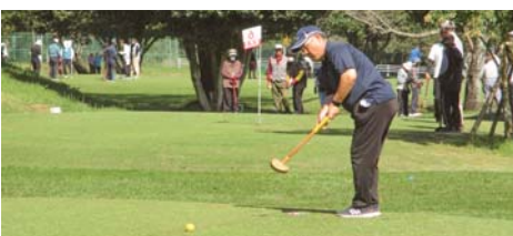
チャリティグラウンドゴルフ大会 80組 362名参加 募金 85,286円