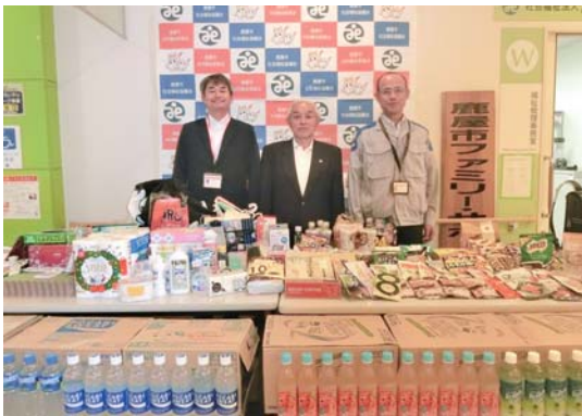
九州電力送配電(株) 鹿屋配電事業所 他3社様